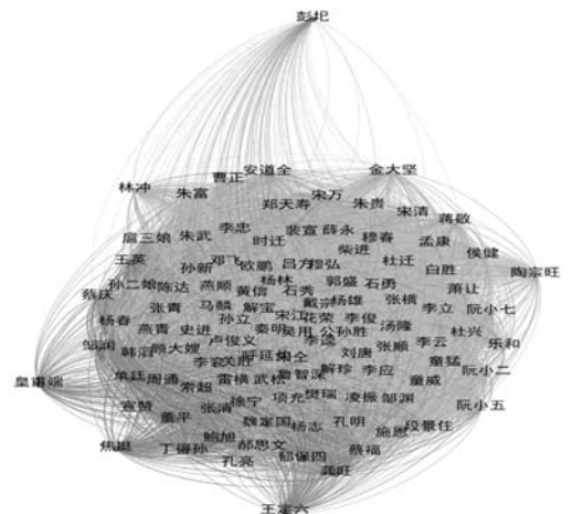
图2 《水浒传》人物关系可视化

人物关系可视化是将人与人之间通过某种属性进行连接而形成的关系网络以图形化的方式表示出来,对于我们的数据集,我们使用 Python 编程语言得到的人物之间连边表格,以及 108 单将的姓名表格,利用网络可视化工具 Gephi 对其进行了人物关系网络可视化,网络可视化的结果如图 2 所示,由于网络的节点度值有三种,分别是 107、106、94,可以看到人物节点的度均较大,因此 108 单将之间关系有明显的聚集性,符合小说故事情节描述。